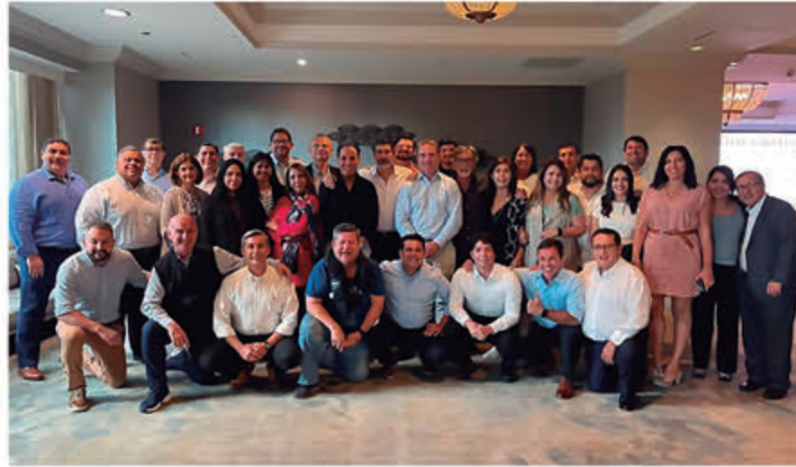
Reunión de Socios - Iberoamérica - Miami, febrero - 2023.

La filosofía, trayectoria, constante mejora y experiencia de Grupo Empresarial Berthin marcan la diferencia en Bolivia. Estos aspectos se fortalecen con su adhesión plena al factor tecnológico actual. Asimismo, ofrece servicios personalizados y cercanos como asesores de confianza. Cuenta con una estructura de oficinas en el eje troncal de nuestro país, cobertura nacional, un equipo profesional multidisciplinario y una red internacional con más de 300 oficinas a nivel mundial.